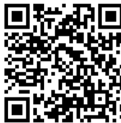
名古屋会場地図QRコード